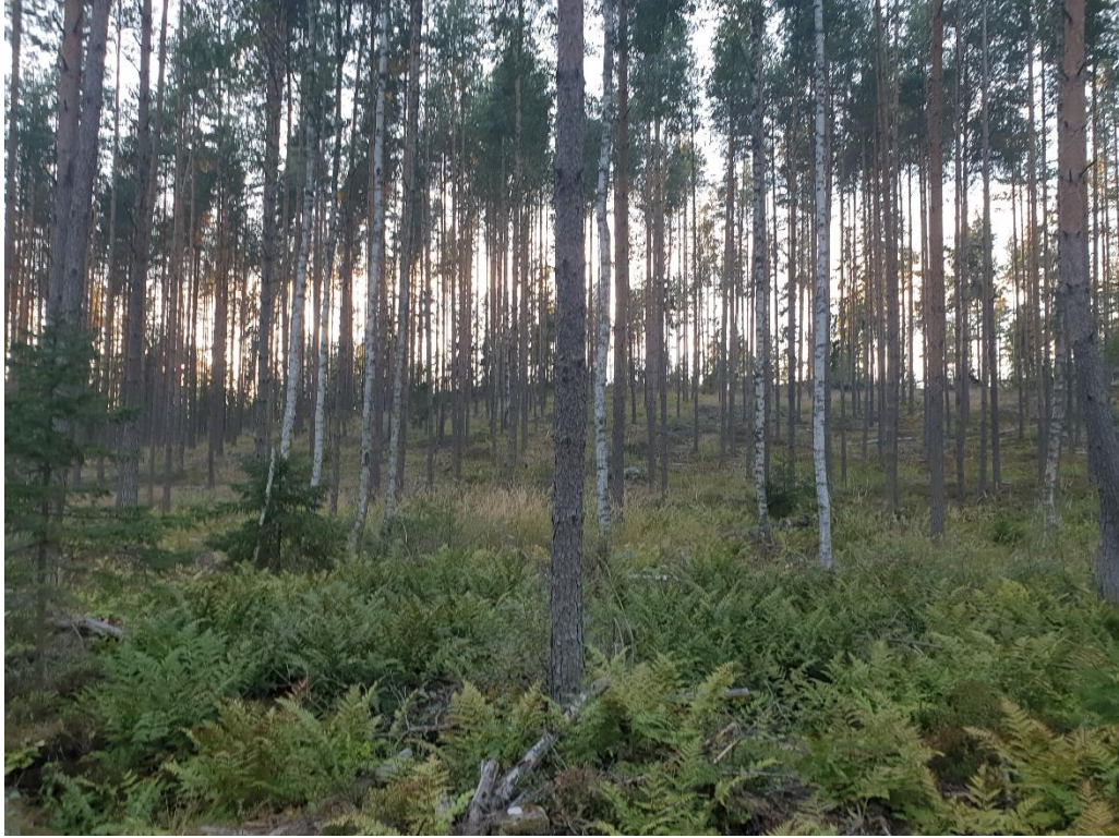
Kuva 3. Kaakkoispuolen metsän sanikkaiskasvustoja; mm. laajalti metsälvejuurta.

Metsäalueella on paljon korkeusvaihtelua ja muutamilla kallioisilla korkeammalla olevilla lakialoilla (Kartta 2) kasvaa kuivaa kangasmetsää (Kuva 4). Valtapuuna on kitukasvuinen mänty ja kenttäkerroksessa eniten maa-alasta täyttävät erilaiset jäkälät. Myös muun muassa kanerva, seinäsammal ja variksenmarja kasvavat runsaana. Nämä alueet ovat pääosin selvinneet hakkuilta ja ovat koskemattomia jo haasteellisen sijaintinsa ja metsätaloudellisen vähäpätöisyytensä vuoksi.