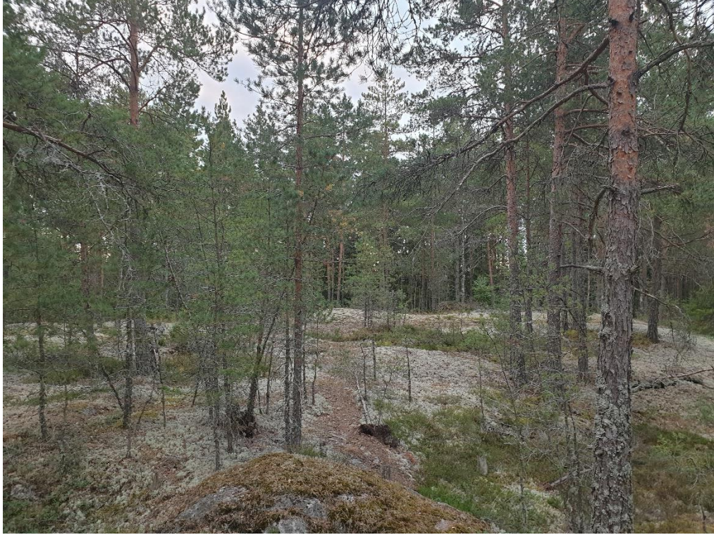
Kuva 4. Alueen kuivaa kangasmetsää lakialueella.

Alueen arvokkain osa (WGS84-koordinaatit N 60.543714, E 22.112026) on pieni ala (Kartta 2), jolla kasvaa iäkkäitä ja järeärunkoisia kuusia. Alueella on kymmenen kuusta, joiden ympärysmitta vaihtelee vajaasta kahdesta metristä kahteen ja puoleen metriin. Nämä ikikuuset eivät täytä luonnonsuojelulain 29 § suojeltua luontotyyppiä ” avointa maisemaa hallitsevat suuret yksittäiset puut ja puuryhmät ”, koska kyseinen ala ei ole avoimessa maastossa näkyvillä maisemassa vaan piilossa metsän ympäröimänä, mutta kuitenkin lähellä golfkentän reunaa. Kuuset ovat siitä huolimatta poikkeuksellisen suuria, ja niillä on sen takia luontoarvoa. Kuusia ympäröivä metsä on harvennettua eikä luonnontilaista.