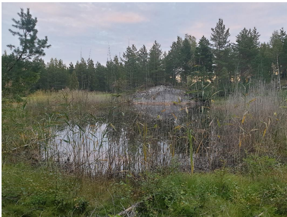
Kuva 1. Suunnittelualueen pienikokoisella lammella on todennäköisesti merkitystä lintujen pesimä- ja levähdyspaikkana.

Suunnittelualueella olevat vesialueet ovat pieni lampi (Kartta 2, Kuva 1) golfkentän kupeessa alueen koillisosassa sekä kaksi alueen läpi kulkevaa pientä osin salaojitettua ojaa. Pienikokoinen lampi on todennäköisesti alun perin ollut soranottoaikka kuten moni muutkin lähialueille aikoinaan syntynyt lampi. Se ei kuulu vesilain 11 § suojeltuihin vesiluontotyyppeihin.