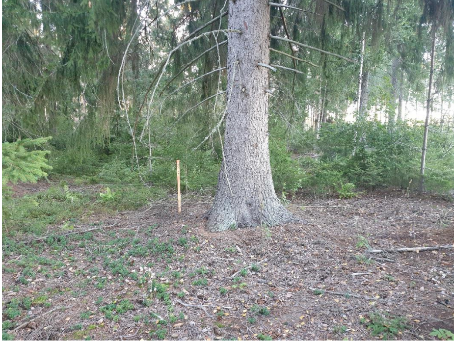
Kuva 5. Yksi kymmenestä iäkkästä kuusesta; kuusen ympärysmitta on reilu kaksi metriä.

Metsäalueella ei tehty havaintoja liito-oravan elinpiiristä eli iäkkäiden puiden juurilla ei ollut liito-oravan jätöksiä. Alueen metsäinen ala ei ole aivan tyypillistä liito-oravan maastoa lukuun ottamatta arvokkainta ikikuusista koostuvaa aluetta.