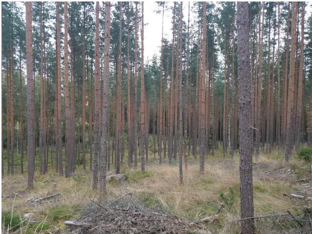
Kuva 2. Alueen voimakkaasti harvennettua metsää, joka on paikoin päässyt heinittymään.

Suurin osa suunnittelualueen metsäalasta on tuoretta sekä kuivahkoa kangasmetsää, jossa on harvennushakkuiden jäljiltä valtapuuna mänty (Kuva 2). Kenttä- ja pohjakerroksessa on runsaasti seinäsammalta ja yleisimpänä varpuna on mustikka, tosin puolukkaakin on runsaasti paikka paikoin. Heiniä esiintyy varsinkin valoisimmilla paikoilla runsaasti. Tavanomaisina metsän lajeina esiintyvät mm. vanamo, sudenmarja, riidenlieko ja metsätähti. Metsä on voimakkaasti harvennushakattua ja valoisaa ja puusto on suurilta osin tasaikäistä, joten kyseinen metsä ei ole luonnontilassa. Metsäalueen kaakkoisosassa kosteammalla kangasmetsäalueella kasvaa saniaisia, kuten yhtenäinen ja laaja metsäalvejuurikasvusto (Kuva 3) sekä reunustoilla runsaasti muun muassa vadelmaa.