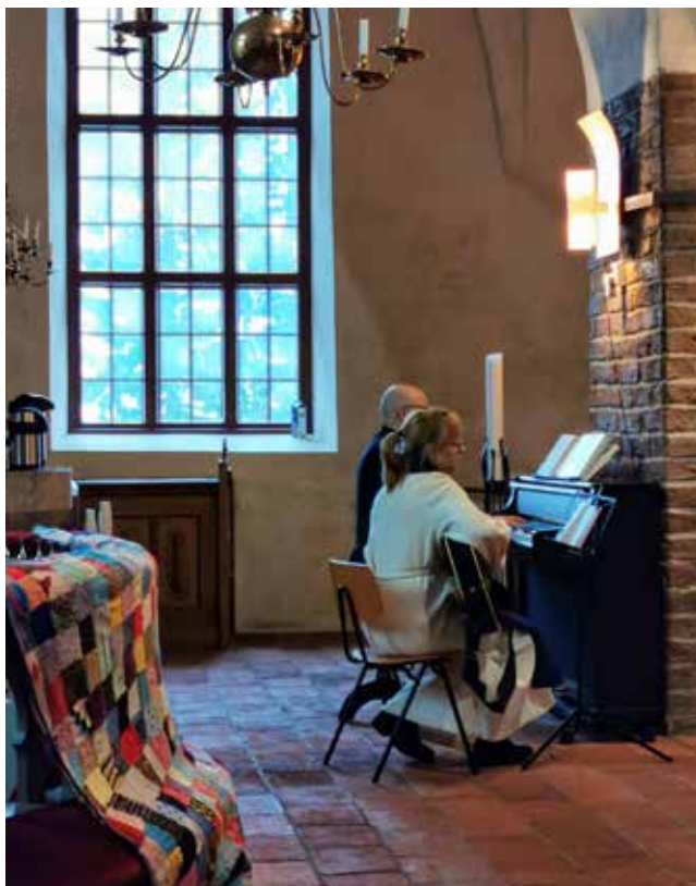
Neulemessu Lemun kirkossa.