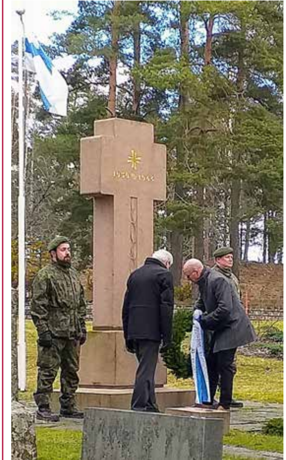
Seppeleen lasku Maskun hautausmaalla. Talvisodan päättymisestä on 80 vuotta

Maskun seurakunnan nuorisotyö siirtyy YouTubeen ja Instagramiin