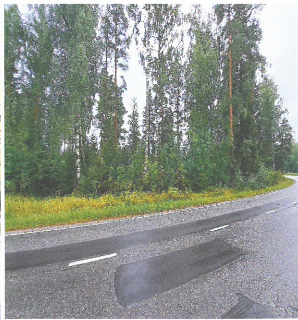
Näkymää Kurittulantieltä sekä pyörätieltä.